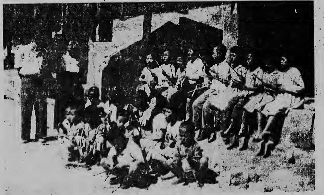
Cu e sistema di banos di ayuda di Unesco, lazonan di amistad entre e paisnan occidental y e hubentud di Korea ta worde forma. Gracias na e ayudo e nos lectionan por welta aki un hanja di muchanan di school na Korea ta haciendo uso cu entusiasmo di e instrumentonan cu por a worde compra pa nan.